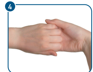
Die Finger ineinander verschränken und die Oberseite der Finger gegen die andere Handfläche reiben.