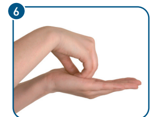
Rotierendes Reiben der Fingerspitzen in der jeweils anderen Handfläche.