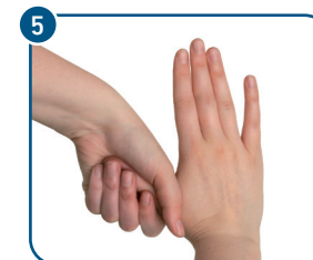
Die Daumen kreisförmig einreiben.