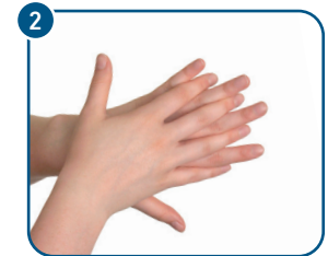
Handfläche gegen den Rücken der jeweils anderen Hand reiben.